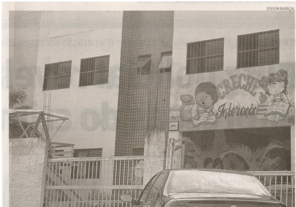
A Creche Interação fica na Rua José Alves de Oliveira, 146, Bairro Jardim Las Palmas, em Guarujá

das crianças matriculadas”, acrescentou, dando conta de que já “fez todos os esforços legais e administrativos necessários para agilizar os processos e garantir o repasse de verbas para as entidades”.